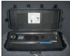
Caja de transporte resistente con opción de barra desmontable