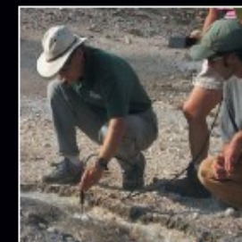
Muestras en un Punto