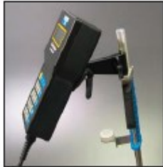
Barra de vadeo de lujo - Sontek Deluxe, con empuñadura y nivel de burbuja

Ningún otro dispositivo de cálculo de caudal por vadeo viene con tantas opciones y accesorios útiles. El FlowTracker es una solución completa y segura.