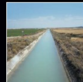
Canales de Riego