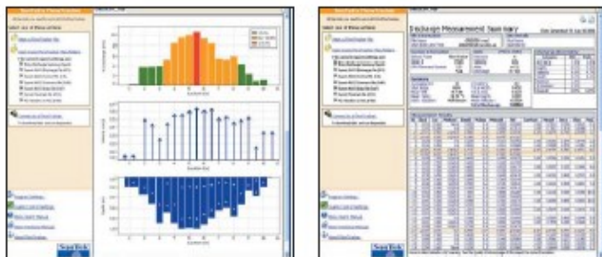
Detalle de un informe de medida de caudal con FlowTracker

Software de análisis de datos con generación y edición de informes en cuestión de minutos y en varios idiomas. Solución ideal para aplicaciones internacionales.