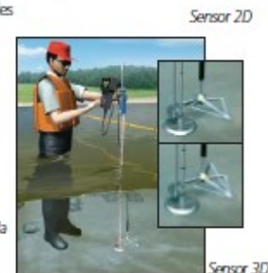
Ejemplo de la técnica empleada con FlowTracker